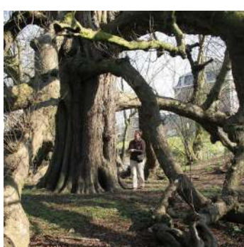
Multiplicité de ses branches

Ce qui les rend Remarquables, ce sont également leurs formes originales :