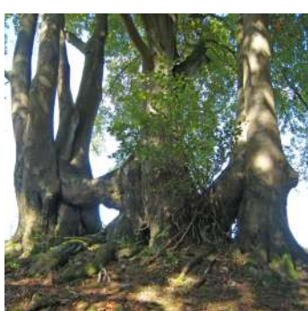
Anastomose de 3 hêtres via leur tronc (fusion physique et fonctionnelle de plusieurs végétaux)