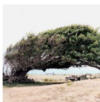
Forme allongée due à une anémomorphose (déformation sous l'action du vent)