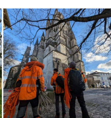
Dévegetalisation de la Cathédrale (17)