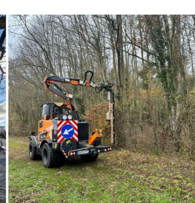
Taille de lisière de forêt (95)