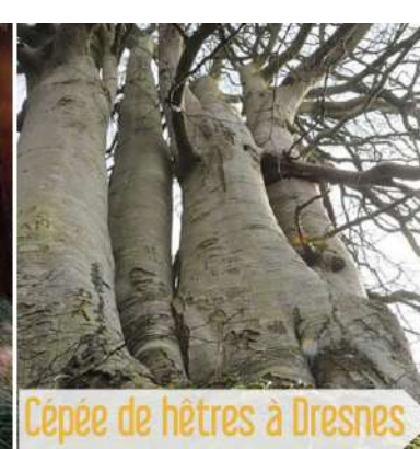
Cèpe de hêtres à Dresnes

Passez leur rendre visite au détour d'une ballade ou de vacances Nature !