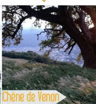
Chêne de Venon